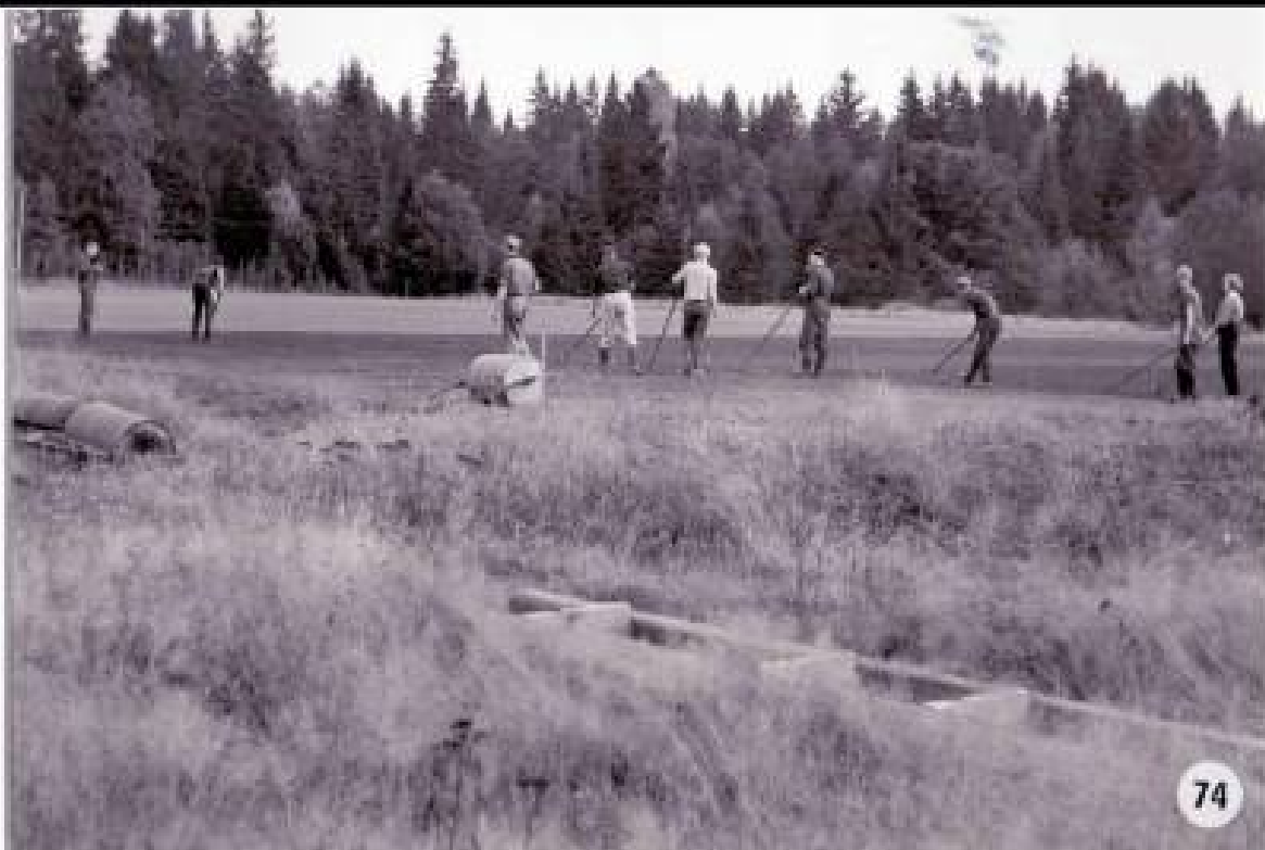
Källebackens Fotbollsplan stod klar 1962.