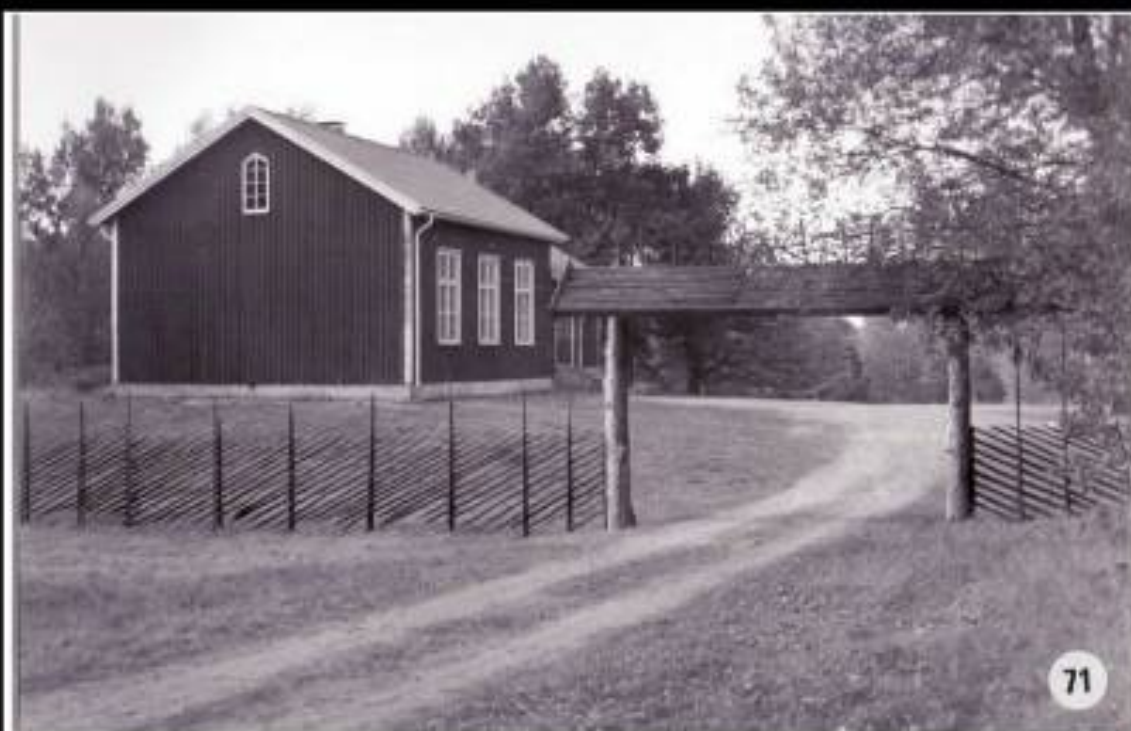
Bjärka skola revs och blev klubblokal. Kjällebacken invigdes 1958.