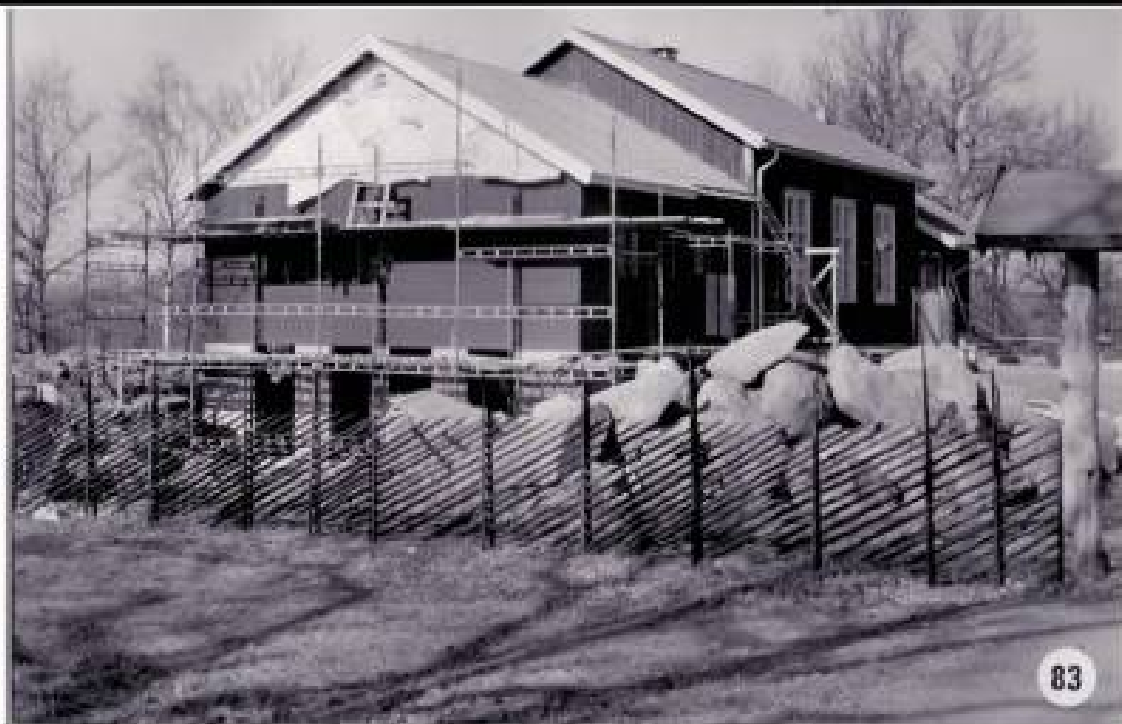
Tillbyggnaden av klubblokalen 1974. Källebakken.