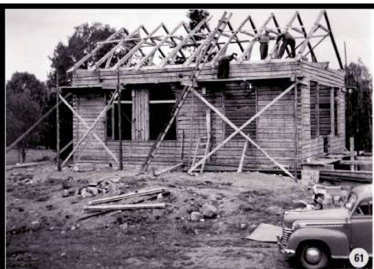
1954 Köpte Härlunda IF Bjärka skola och rev den, och byggde en klubblokal Källebacken.